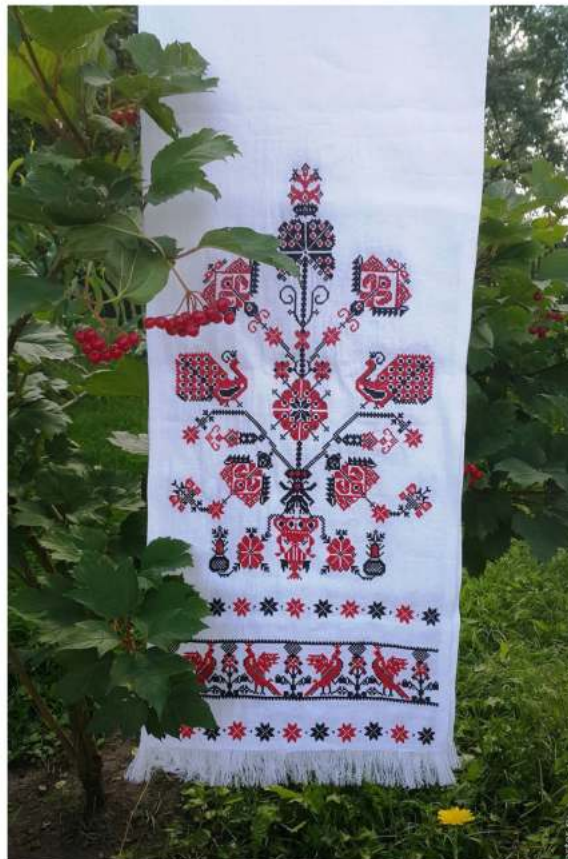
Изображение 2: силуэтное изображение