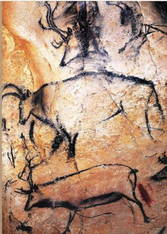
Изображение 1: частичное изображение

ИЗОБРАЖЕНИЕ СТАЛО ЕДИНСТВЕННОЙ ФОРМОЙ существования. Человек научился стилизовать и упрощать формы. Это дало ему уверенность в себе, проводя, по сути, сеансы группового аутотренинга.