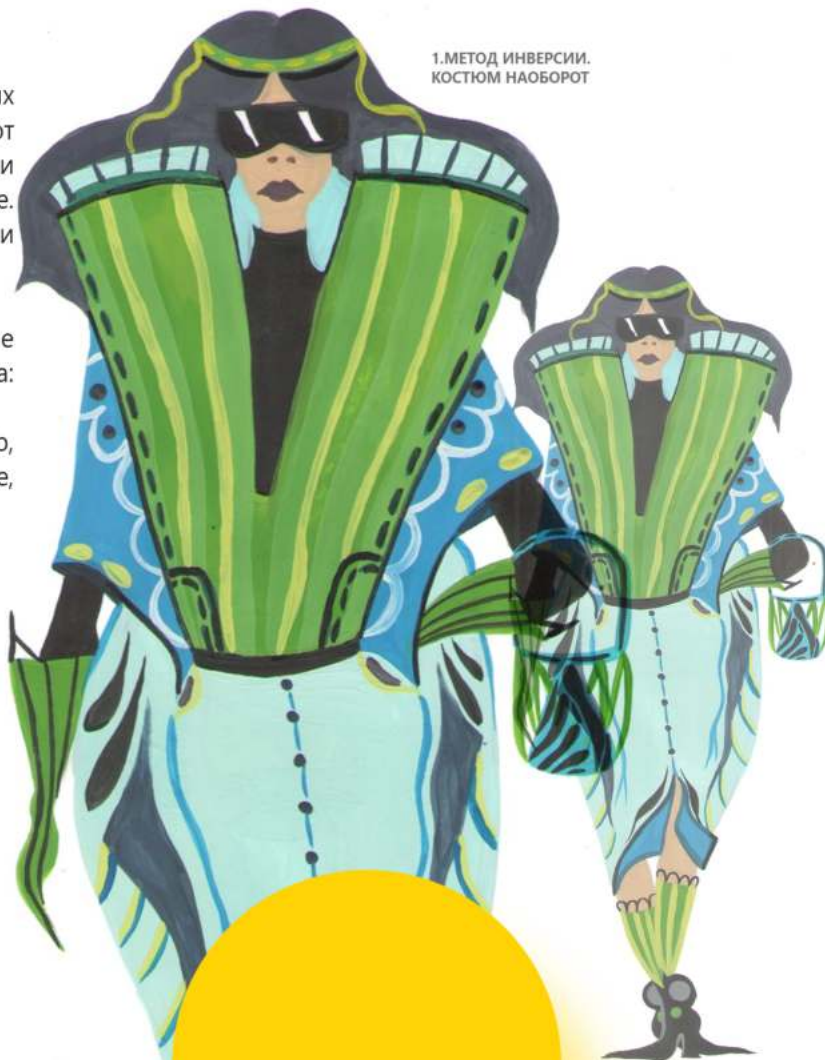
1. МЕТОД ИНВЕРСИИ. КОСТЮМ НАОБОРОТ

Метод основан на применении аналогичных положений для получения новых идей. Эти аналогии учащийся может найти и в природных формах, и в различных областях человеческой деятельности. Различают прямые, субъективные, символические, фантастические источники аналогий. Этот метод требует от учащегося знания истории искусств, знакомства с музыкальными произведениями, литературой. При использовании этого метода существует различная степень переработки источника: